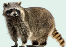
raccoon - medvedík čistotný