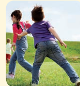
catch - chytiť