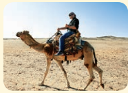
ride a camel - jazdiť na ťave