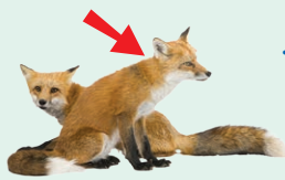
fox (foxes) - líška/líšky