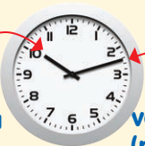
big hand - velká ručička (na hodinách)