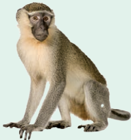
monkey - opica