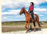
ride a horse - jazdiť na koni