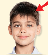
hair - vlasy