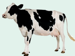
cow - krava