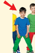
boy - chlapec girl - dievča