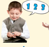
count - počítat