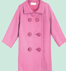
coat - kabát