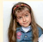
sister - sestra