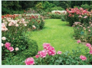
garden - záhrada