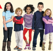
child (children) - dieťa (deti)