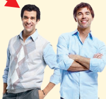
man (men) - muž/muži