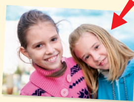
friend - priateľ