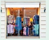
shop - obchod