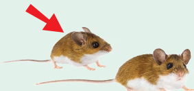
mouse (mice) - myš (myši)