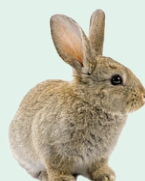
rabbit - králik