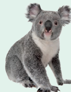
koala - koala