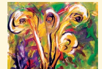
painting - malba