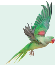
parrot - papagáj