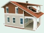
house - dom