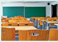
classroom - trieda