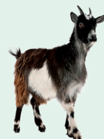
goat - koza