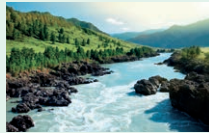
river - rieka