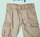
shorts - šortky, krátke nohavice