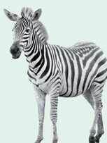
zebra - zebra