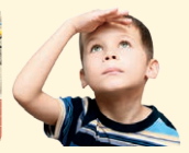
see - vidieť