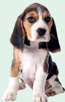
dog - pes