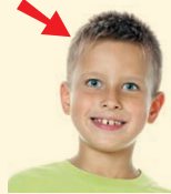
head - hlava