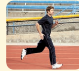
run - bežať