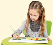
paint - malovať