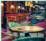
café - kaviareň