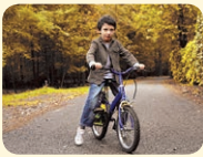
ride a bike - bicyklovať