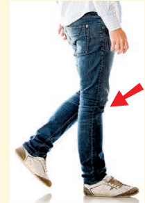
leg - noha