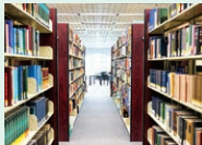
library - knižnica