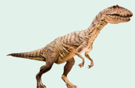
dinosaur - dinosaurus