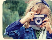
take a photo - fotografovať