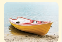
boat - čln