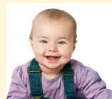
baby - bábätko