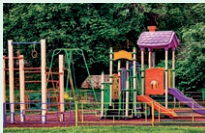
playground - detské ihrisko