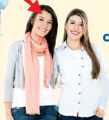
woman (women) - žena/ženy