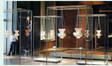
museum - múzeum