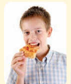
eat - jesť