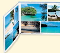
album - album