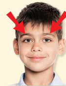
eyes - oči