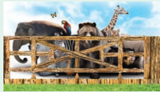
zoo - zoológická záhrada