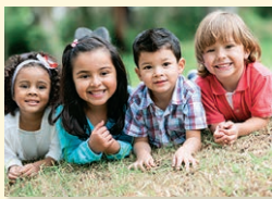
kids - deti